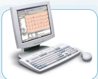
Welch Allyn CardioPerfect™ Workstation